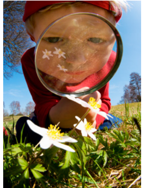
Nyfiken son, Möllegård, Halland