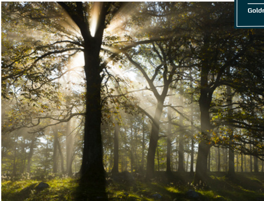
Ångsljus i ekskogen, Hjärnered, Halland